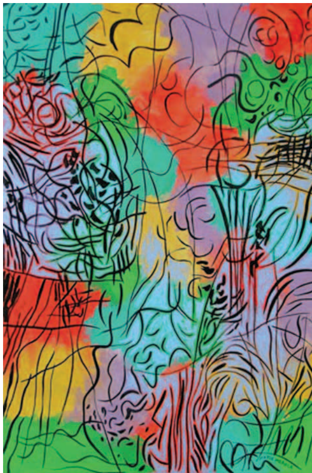
Contrastes , 1998 Encre et acrylique sur papier 112 x 77 cm Collection Musée des beaux-arts de Sherbrooke

Mario Merola n'affirmait-il pas, dans une conférence prononcée en 1974, que «... la composition d'ensemble se développe à partir d'une grille ouverte. Le support homogène, structuré par l'opposition de lignes de force horizontales et verticales, m'a permis